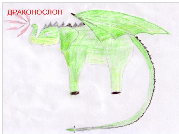
Яковлев Всеволод – 5 б.