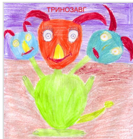
Секриер Ирина – 5 б.