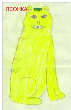
Обрезкова Алиса – 7 б.